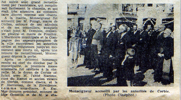
Monsieur accueilli par les autorités de Corbie.